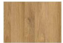
Dąb Grandson Naturalny