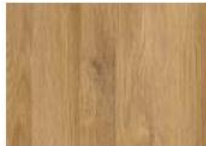
Dąb Grandson Naturalny